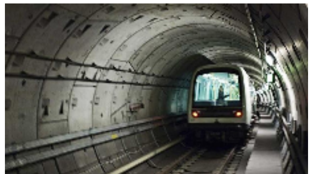
Metrotog i røret.

Kilder: www.nytbynet.dk www.gladsaxebladet.dk www.m.dk www.pinterest.com www.wikipedia.org