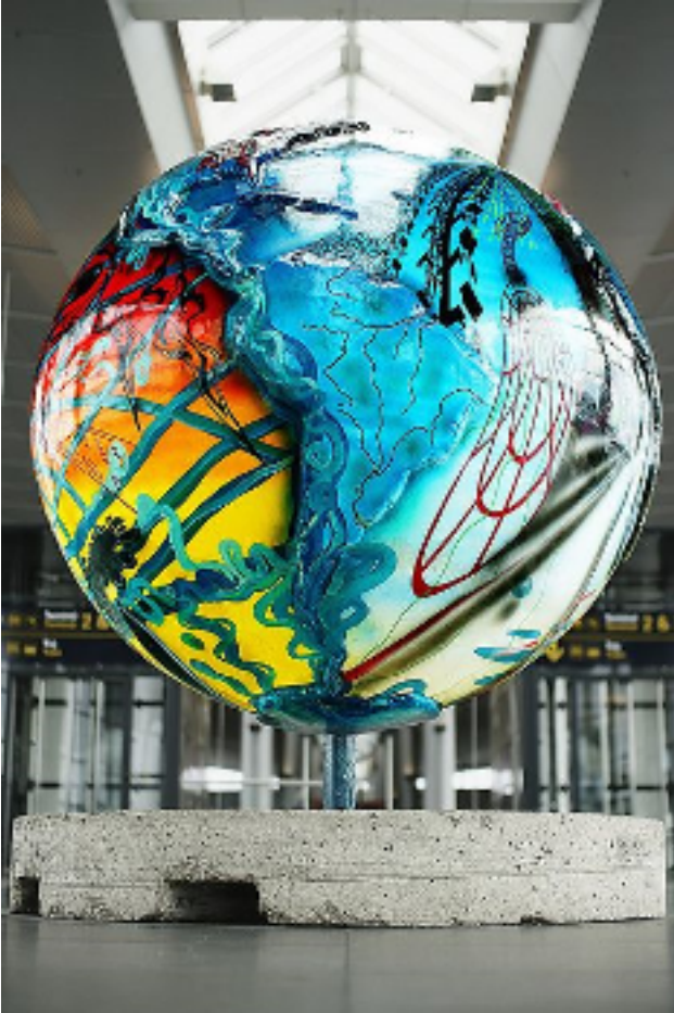
Globuskunst ved Kastrup Metrostation.